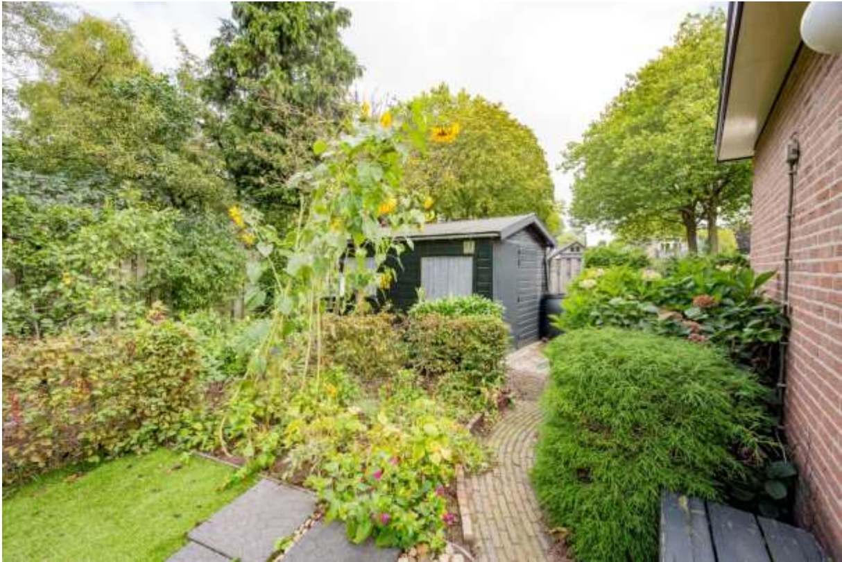
Achtertuint met houten berging