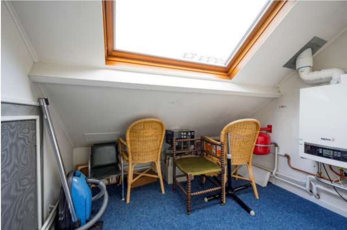
Slaapkamer met een dakraam