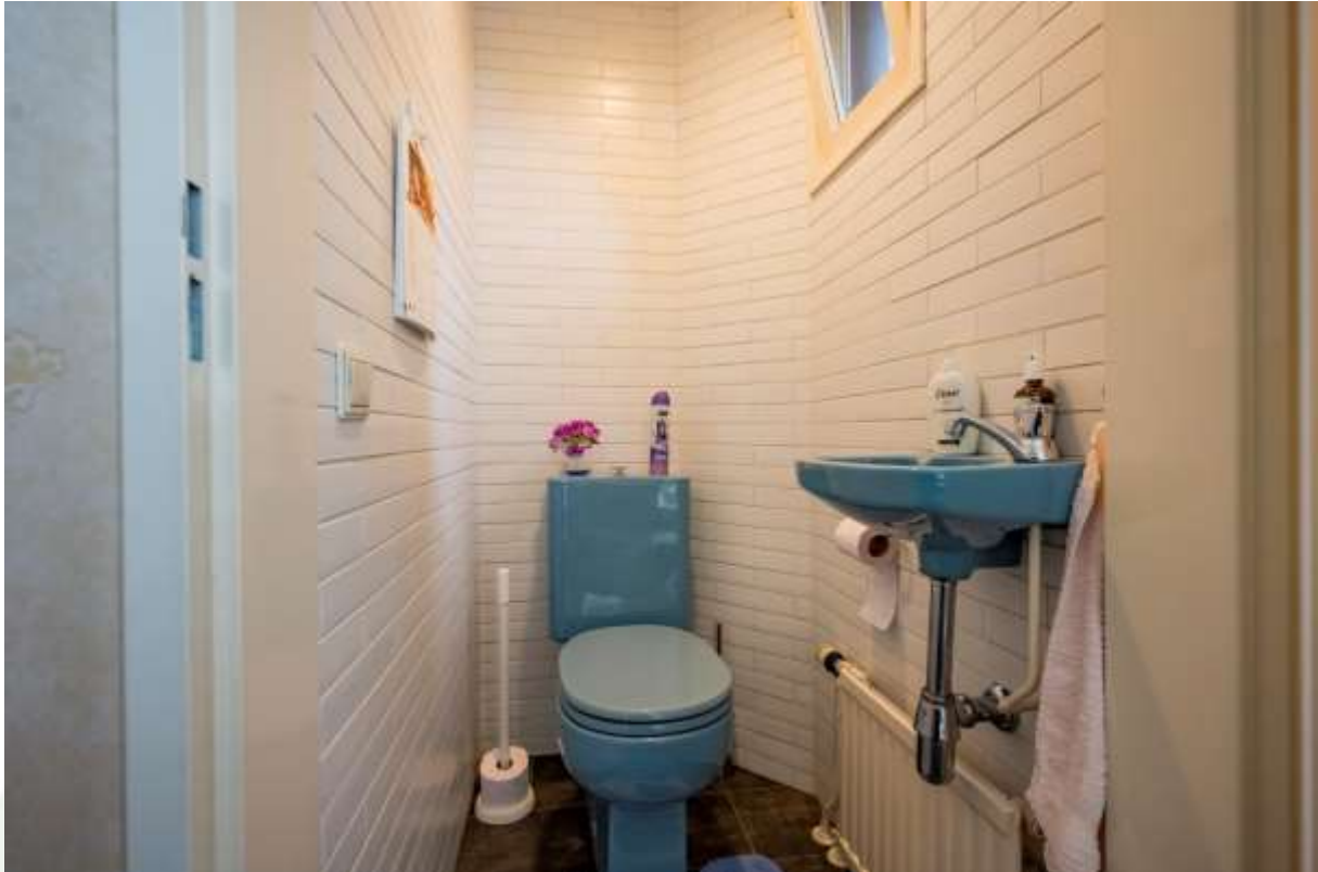
Toilet in hal