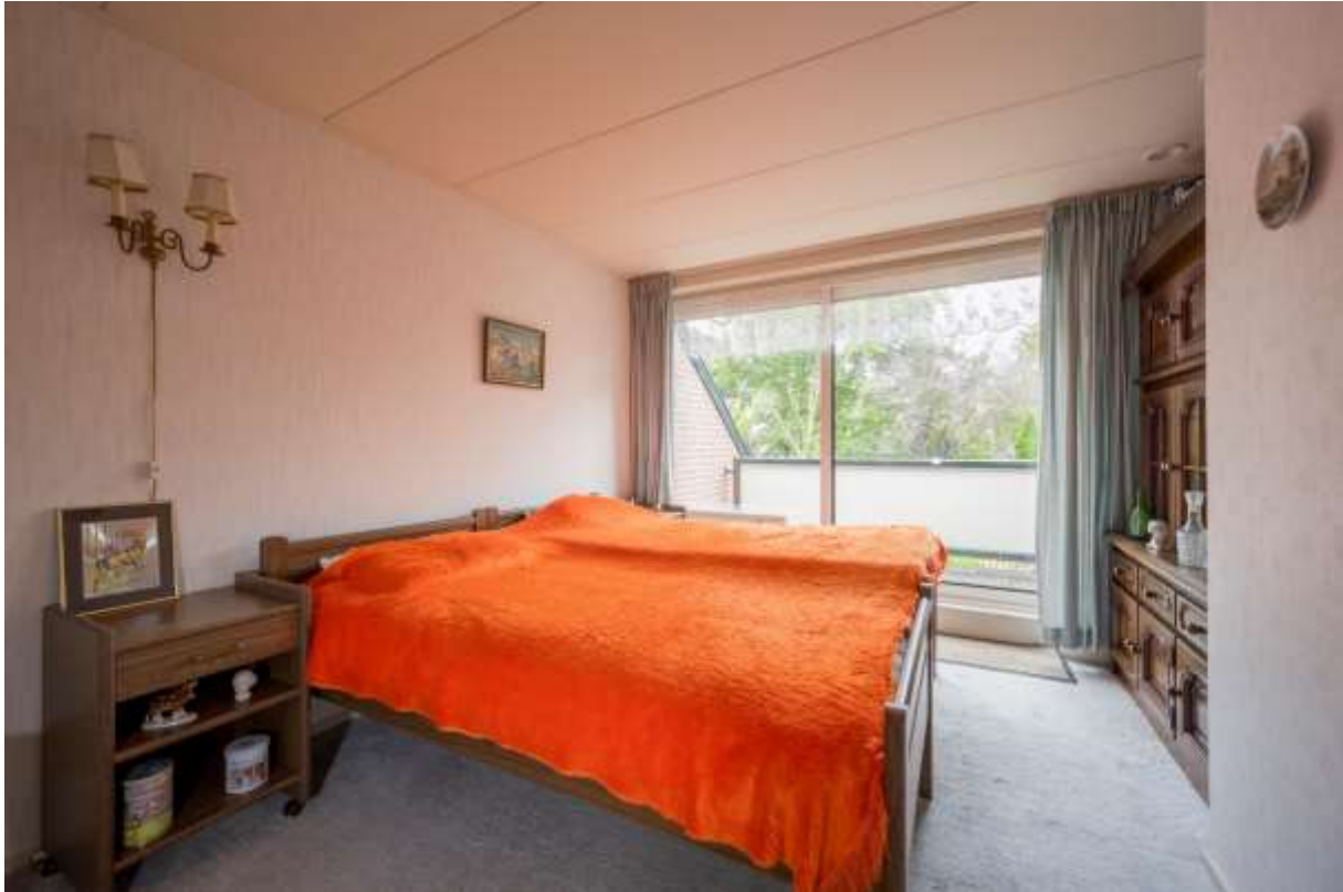
Ouderslaapkamer met vaste kastenwand, en toegang tot het balkon.