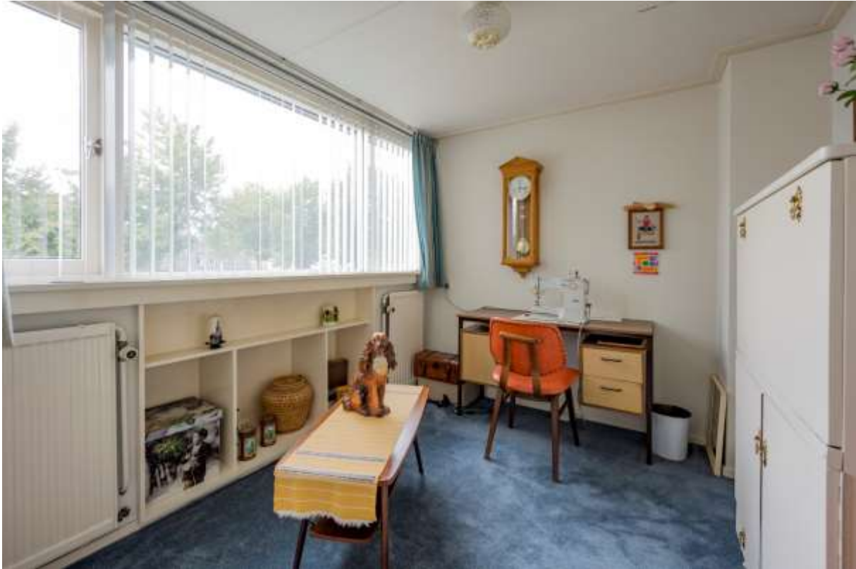
Slaapkamer met dakkapel gesitueerd aan de voorzijde