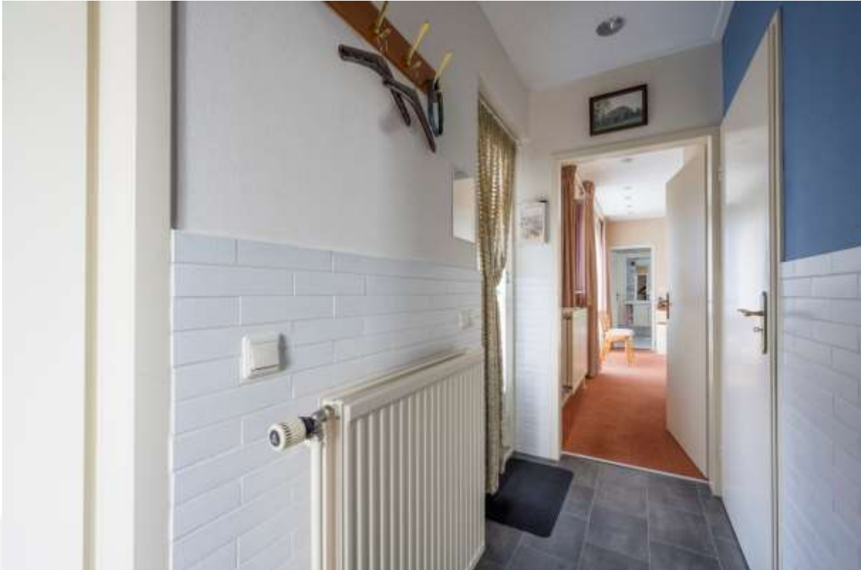
Gang naar de slaapkamer op de begane grond en toegang tot de inpandige garage.