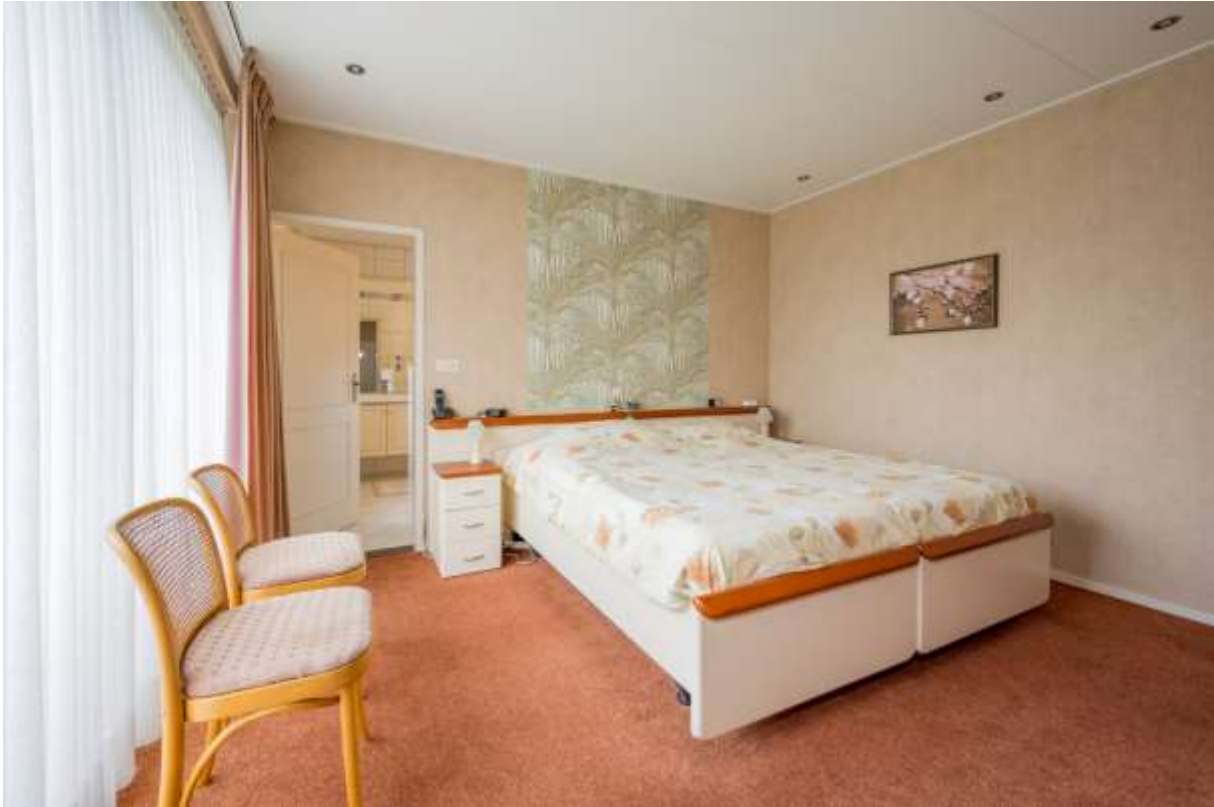
Slaapkamer met een schuifpui